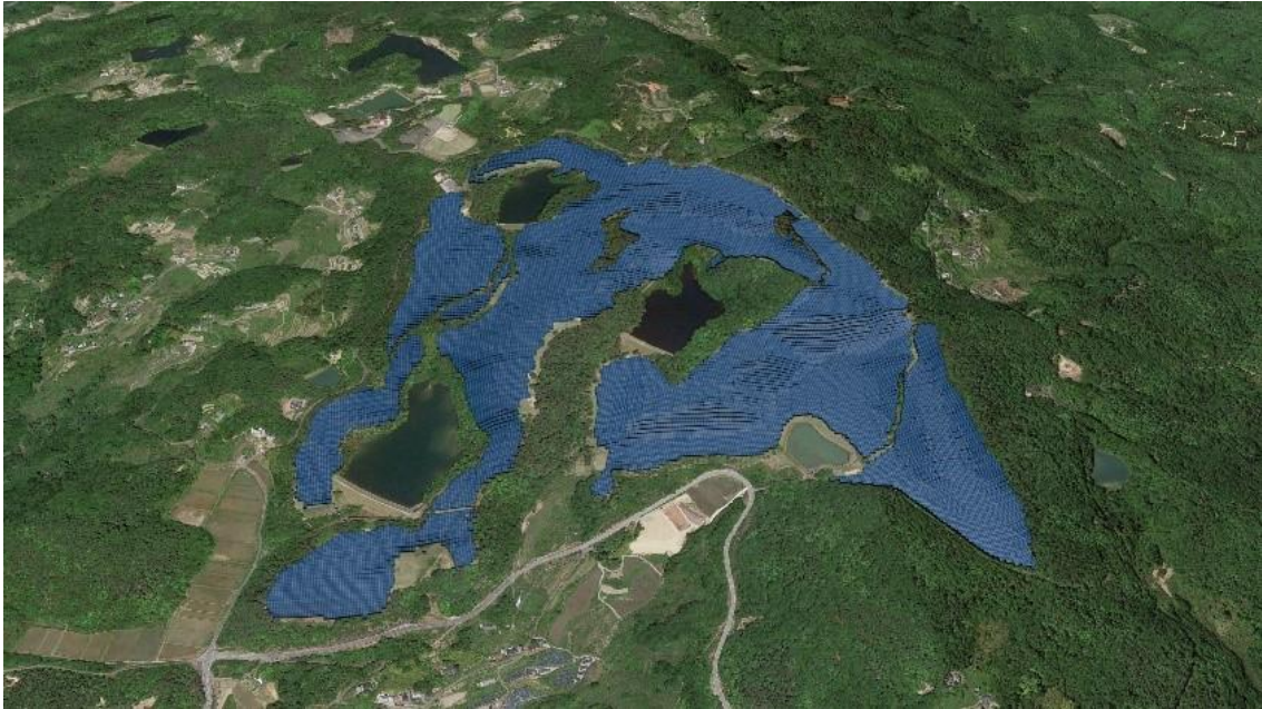
備前メガソーラー発電所 完成イメージ図